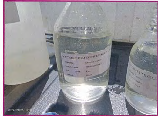
ภาพที่ 1-2 แสดงการเก็บตัวอย่างคุณภาพน้ำผ่านการบำบัด (ก่อนลงบ่อบัว)