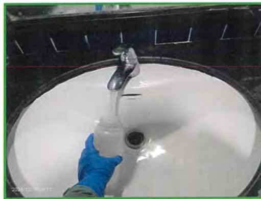
ภาพที่ 3 แสดงการเก็บตัวอย่างคุณภาพน้ำใช้